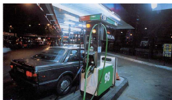
Pompe à essence

Comment assurer que d'importants volumes de marchandises, comme le pétrole brut ou le gaz naturel, qui font l'objet de transactions commerciales avec des millions de tonnes de pétrole ou les mètres cubes de gaz achetés et vendus, sont mesurés de façon correcte, du supertanker à la pompe à essence et du gazoduc qui traverse les frontières et dans lequel le gaz circule sous haute pression jusqu'au compteur à gaz domestique ?